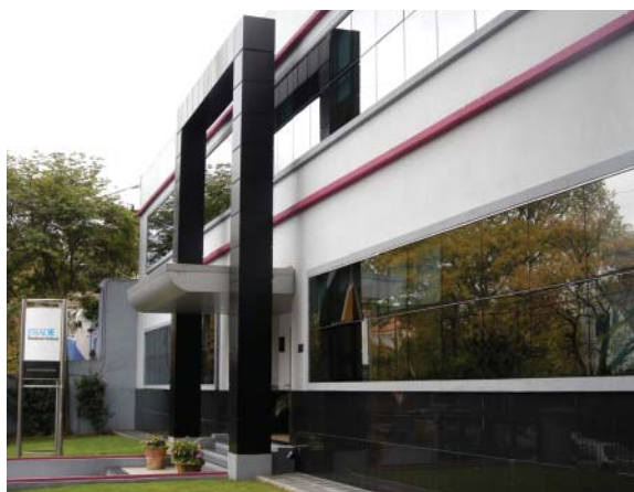
ESADE Business School

ESADE Business School es una institución de prestigio internacional, fundada hace más de 50 años en Barcelona gracias a la iniciativa de un grupo de empresarios catalanes y miembros de la Compañía de Jesús.