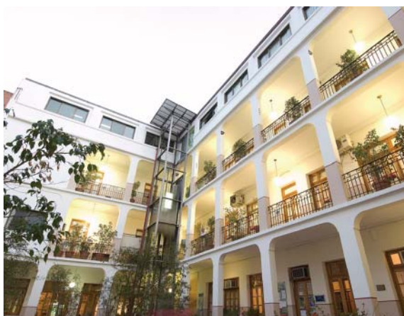
ICDA - Universidad Católica de Córdoba

La presencia de ESADE en Córdoba está impulsada por su decidida apuesta en favor de la perspectiva global que caracteriza esta etapa de su vida institucional y expresa su vocación por el trabajo cooperativo y solidario. Además, ya existe una larga relación con el ICDA, enriquecida por las raíces Ignacianas de ambas instituciones, uno de cuyos frutos fue precisamente la primera edición del PMD® en esta ciudad, en el año 2007, y la segunda en el año 2012.